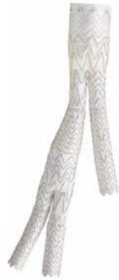
Y型グラフトにY型グラフト が組み合わさった形状