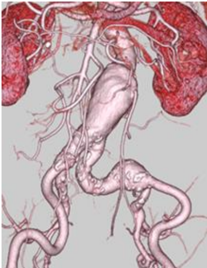
内腸骨動脈瘤を伴う腹部大動脈瘤